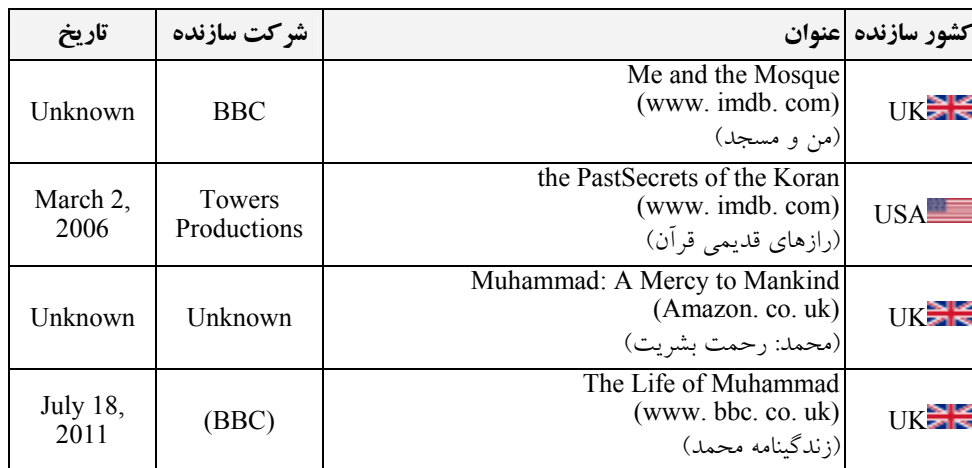
جدول ۵: توصیف نمودهای مخالفت با اسلام و تفکیک آنها از یکدیگر