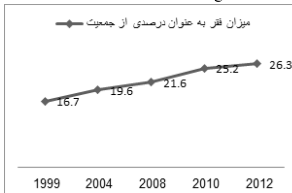
نمودار ۳: رشد فزاینده فقر در مصر به‌عنوان درصدی از جمعیت (سومین نمودار)