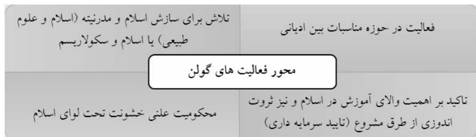
شکل ۲: محور فعالیت‌های گولن

برخی از مهم‌ترین آثار گولن عبارت‌اند از: از قرآن به ادراک (دو جلد) ، عصر و نسل ، مضرب شکسته ، مجموعه دعاها، موازین یا چراغ‌های بر فراز راه ، از فصلی به فصل دیگر و تپه‌های زمردین قلب ؛ کتاب جدید او را نیز که مجموعه‌ای از مقالات و سخنرانی‌های او درخصوص خشونت، جنگ و تروریسم است، شاگردانش جمع‌آوری کرده و با عنوان مسلمانان و مسئولیتشان در مواجهه با خشونت انتشار داده‌اند؛ محور فعالیت‌ها و پس‌زمینه فکری آنها به‌صورت طرح کلی (شماتیک) در زیر آورده شده‌است: