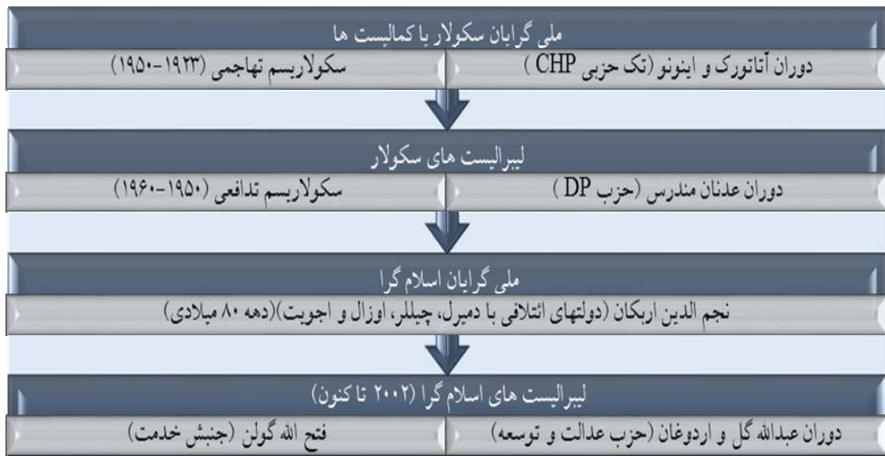
شکل ۳: روند گفتمان‌های سیاسی در ترکیه مدرن

تفسیر متفاوت از ملی‌گرایی را ارائه دادند. آکچورا مهاجر ترک‌تبار روسی همانند سایر همفکرانش در اندیشه ارتباط ترک‌های آناتولی با جهان ترک بود؛ در مقابل، گؤک‌آلپ از نوعی ملی‌گرایی آناتولیایی دفاع می‌کرد (کؤشه‌بالابان، ۱۳۹۲: ۹۹). آکچورا معتقد بود که ترک‌گرایی به‌نسبت اسلام‌گرایی در سیاست خارجی، بهتر عمل می‌کند و حساسیت اروپایی‌ها را کمتر برمی‌انگیزد (آکچورا، ۱۹۰۴: ۸-۹). گؤک‌آلپ، میان فرهنگ و تمدن، تمایز قائل می‌شد. «فرهنگ»، عنصر اصلی سازنده هویت ملی و «تمدن»، امری عمومی تلقی می‌شد که دیدگاهی عمل‌گرایانه‌تر بود که به ظهور کمالیسم انجامید. سه راه سیاست آکچورا اگرچه از سقوط امپراتوری عثمانی جلوگیری نکرد، اساس هویت ملی ترکیه مدرن را شکل داد که متعاقب آن، قانون اساسی جمهوری ترکیه در سال ۱۹۲۱ تدوین شد و در ۲۹ اکتبر ۱۹۲۳ (۶ آبان ۱۳۰۲)، حکومت از سلطنت (پادشاهی) به جمهوری تغییر یافت؛ بدین ترتیب، تقابل اسلام و سکولاریسم از یک‌سو و لیبرالیسم و ناسیونالیسم از سوی دیگر، چهار گفتمان عمده سیاست در ترکیه را شکل دادند که به‌صورت طرحی کلی در زیر آورده شده است: