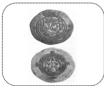
شکل شماره ۲- درهم معاویه

درهم معاویه، دارابجرد در حدود سال‌های ۵۵-۵۴ روی سکه: نیم‌رخ ساسانی عربی با نام معاویه امیر المومنین (به فارسی میانه) حاشیه: بسم‌الله. روی دیگر سکه: آتشکده عربی ساسانی باخدمه‌هایی با مخفف نام ضراب و تاریخ به فارسی میانه حدود سال‌های ۵۵-۶۷۴/۵۴. حاشیه پشت سکه: خالی