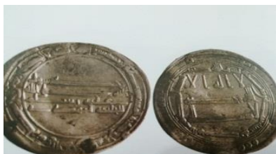
شکل ۱۰ - سکه عباسی؛ درج نام خلیفه کنار نام پیامبر

عباسی - المهدی ۱۶۰ ه.ق؛ روی سکه: محمد رسول الله صلی الله علیه و سلم / الخلیفه المهدی؛ حاشیه: محمد رسول الله ارسله بالهدی و دین الحق لیظهره علی الدین کله و لو کره المشرکون. پشت سکه: لا اله الا الله وحده لا شریک الله؛ حاشیه: بسم الله ضرب هذا الدرهم بالمحمدیه سنه ستین و مئه.