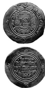
شکل شماره ۵- درهم عبدالعزیز بن عبدالله (حاکم زیری سیستان)

شکل ۵- درهم عبدالعزیز بن عبدالله حاکم زیری سیستان، ۶۹۱-۲/۷۲. روی سکه: مجسمه نیم تنه عربی ساسانی متاخر با کتیبه‌هایی به فارسی میانه چپ: «فلیزد مدجده» (راست): عبدالعزیز بن عبدالله بن امیر. حاشیه روی سکه: /بسم‌الله / العزیز» پشت سکه: نوشته‌ای به فارسی میانه در پنج خط: «اثنتان وسبعون / إله واحد، عده / لا توجد آلهة أخرى / محمد رسول‌الله». حاشیه پشت: خالی