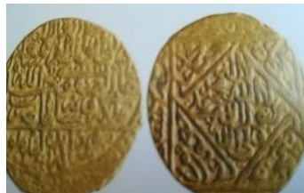
شکل شماره ۱۲- سکه شاه اسماعیل صفوی

صفوی، شاه اسماعیل، ۹۰۶-۹۳۰ ه. روی سکه: السلطان العادل الکامل الهادی الوالی ابوالمظفر شاه اسماعیل بهادرخان صفوی خلدالله ملکه و سلطانه ضرب فی تربت؛ پشت سکه: داخل لوزی: لاله الا الله محمد رسول الله علی ولی الله. حاشیه لوزی؛ علی، حسن، حسین، علی، محمد، جعفر، موسی، علی، حاشیه مربع: نادعلیا مظهرالعجایب تجده عونالک فی النوائب کل هم و غم سینجلی بولایتک یاعلی یا علی.