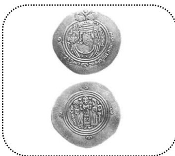
شکل شماره ۶- خلیفه در حالت ایستاده و نماز

شکل ۶- درهم خلیفه بصره. روی سکه: تصویر نیم مجسمه متأخر عربی ساسانی با نام بشیر بن مروان (به فارسی میانه) حاشیه روی سکه: الف نون؟ (به فارسی میانه) «بسم الله محمد رسول الله» پشت سکه سه دایره بسته با سه شخص ایستاده در درون شخص وسط با دو خدمه در کنار به‌عنوان خلیفه یا خطیب مروانی مشخص است باشد.