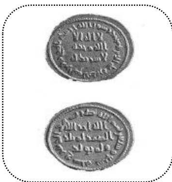
شکل شماره ۸- دینار نوشتاری دوره اموی

شکل ۸- دینار ضرب شده به نقوش کتابت. دوره عبدالملک. دمشق ۶۹۶-۷۷۷. روی سکه: «لا إله إلا الله وحده لا شریک له». حاشیه رو: «محمد رسول الله أرسله بالهدی و دین الحق لیظهره علی الدین کله سوره توبه آیه ۳۳» پشت سکه: «الله أحد الله الصمد لم یلد ولم یولد ولم یکن له کفوا احد». حاشیه پشت: «بسم الله ضرب هذه الدینار سنة سبع وسبعین»