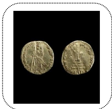
شکل شماره ۳- دینار معاویه

خلیفه ایستاده. دیناری با صلیبی تغییر یافته در جهت معکوس ضرب شده در احتمالاً دمشق تولید شده هر ساله در فاصله ۷۴ تا ۷۷ ه. ق. روی سکه: شمایل خلیفه در حالت ایستاده عادی بر گرداگرد آن: بسم‌الله لا اله الا الله وحده محمد رسول الله. پشت سکه: صلب کله‌پا شده بر گرداگرد آن: «بسم‌الله ضرب هذا الدینار سنه سبع و سبعین»