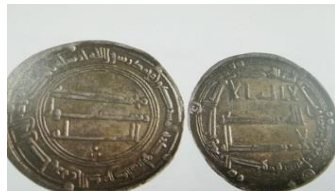
شکل ۹ - سکه عباسی با درج شعار محمد رسول الله

سکه: عباسی - المنصور، ۱۴۴ ه.ق. روی سکه: محمد رسول الله؛ حاشیه رو: محمد رسول الله ارسله بالهدی و دین الحق لیظهره علی الدین کله و لو کره المشرکون. پشت سکه: لا اله الا الله وحده لا شریک الله؛ حاشیه پشت: بسم الله ضرب هذا الدرهم بالکوفه سنه اربع و اربعین مئه.