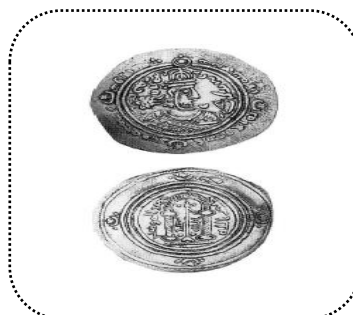
شکل شماره ۷- درهم محراب و نیزه

شکل ۷- درهم «محراب» و «نیزه» بدون ضارب و تاریخ. اما احتمالاً ضرب شده در دمشق در میانه دهه ۷۰ قرن اول هجری. روی سکه با دو دایره نقطه‌نقطه با تصویری در نگاه به راست با عبارت «فلیزدد مجده/خسرو» به فارسی میانه در دور تصویر. مجسمه کاملاً به شکل نوع ساسانی آن است؛ در خط، به‌ویژه در کلاه در بازوهای قابل مشاهده و شمشیر آویخته بر دست سمت راست. حاشیه: «بسم الله لا إله إلا الله وحده محمد رسول الله» پشت سکه: سه دایره بسته دو ستون که طاقی را حفظ می‌کنند (محراب)، فریم یک نیزه بر گردادگرد آن. عبارت چپ: امیر المومنین راست: نصار الله یا نصر الله. تردول به شرحی متقاعدکننده استدلال می‌کند که قوس بالای دو ستون در جهت عکس باید به‌مثابه حرم (تصویری سه‌بعدی از محراب) و نه محراب دیده شود.