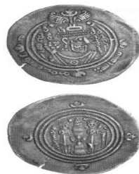
شکل شماره ۴- درهم عبدالملک ابن عبدالله (حاکم زیری بیشاپور)

شکل ۴- درهم: عبدالملک بن عبدالله، حکم زیری بیشاپور روی سکه: مجسمه نیم تنه ساسانی عربی با نام «عبدالملک بن عبدالله» (به فارسی میانه) حاشیه روی سکه: بسم‌الله / محمد رسول‌الله. پشت سکه: آتشکده عربی ساسانی باخدمه و مخفف نام ضراب و تاریخ به فارسی میانه احتمالاً ۶۶/۶-۶۸۵ پشت سکه: اشکال گلوله‌ای شکل