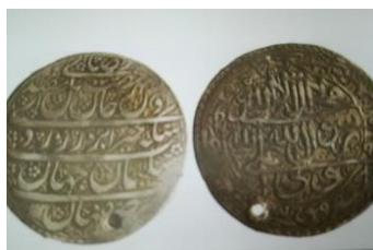
شکل شماره ۱۴- سکه شاه سلیمان صفوی

صفوی-سلیمان، ۱۰۸۳ ه. روی سکه: بهر تحصیل رضای مقتدای انس و جان/ سکه خیرات برزرزر سلیمان جهان. پشت سکه: لااله الا الله الا الله، محمدرسول الله، علی ولی الله، حاشیه سکه: علی، حسن، حسین، علی، محمد، جعفر، موسی، علی، محمد، علی، حسن، محمد.