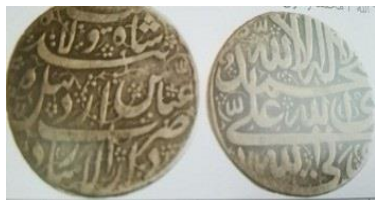
شکل شماره ۱۳- سکه شاه‌عباس صفوی

روی سکه: بنده شاه ولایت عباس، ضرب دار الارشاد اردبیل، پشت سکه: لاله الا الله محمد رسول الله علی ولی الله.