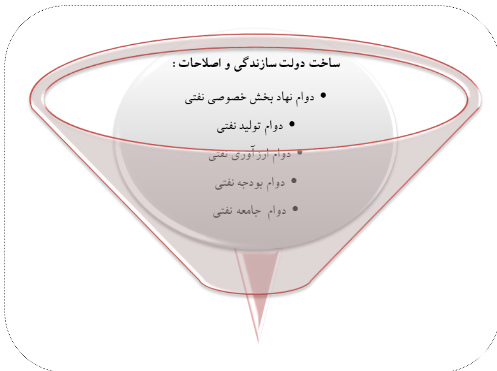
نمودار ۳. راز بقای ساخت دولت رانتیه در دولت‌های سازندگی و اصلاحات

می‌کنند» (کرد زاده کرمانی؛ ۱۳۸۰: ۵۴). بعد از انقلاب و به‌خصوص بعد از جنگ گروه‌ها و افرادی در کشور رشد کردند که عادت به استفاده از رانت‌های دولتی و سودجویی زالو وار از امکانات دولتی پیدا کردند و از این راه آن‌ها رانت‌های متعددی به دست آوردند و قسمت اعظم سرمایه‌داران نوکیسه از آنجا پدید آمد. پس از خرید کارخانه، زمین و امکانات کارخانه را می‌فروختند و پول آن را از کشور خارج کردند و یا در داخل پول آن را صرف کارهای تجاری و بازرگانی و واسطه‌گری کردند» (احمدی آمویی؛ ۱۳۸۵: ۳۹۶ - ۳۹۷). «در برنامه اول توسعه اقتصادی، ۴۲ درصد از درآمدهای ملی به ۱۰ درصد خانواده‌های ثروتمند اختصاص یافت؛ درحالی‌که ۲۰ درصد خانواده‌هایی که طبقه پایین جامعه را تشکیل می‌دادند فقط ۳/۸ درصد از این درآمد، نصیب آن‌ها شد». (احتشامی، ۱۳۷۸: ۵۳ و ۵۴). در حقیقت روابط نفتی بین جامعه و دولت در این دوران، تصویر کپی شده‌ای از روابط بین جامعه و دولت پهلوی بود.