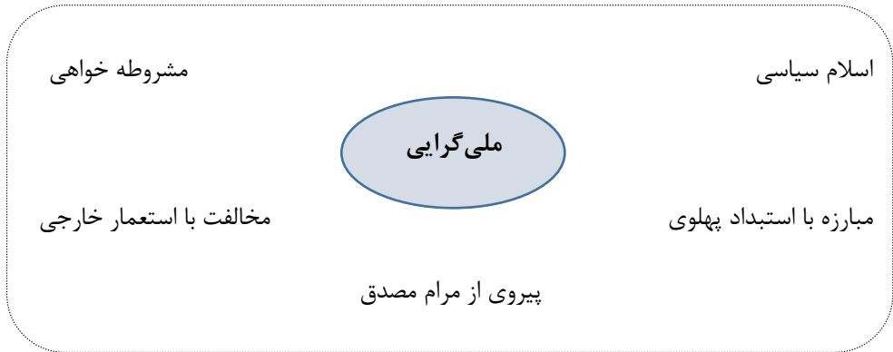
شکل ۲- نمایش دال مرکزی و دال‌های شناور خرده‌گفتمان اسلام ملی‌گرا

را به مثابه فروش موقعیت سوق‌الجیشی ایران به امپریالیسم تلقی نموده و همچنین طرح انقلاب سفید را طرحی تحمیلی از خارج و قدرت‌های بیگانه می‌دانست. (نهضت آزادی ایران، ۱۳۶۱: ۲۲۱). بنابراین ملی‌گرایی، نشانه محوری خرده‌گفتمان اسلام ملی‌گرا بود و نشانه‌های دیگر به عنوان دال‌های شناور آن به شمار می‌روند.