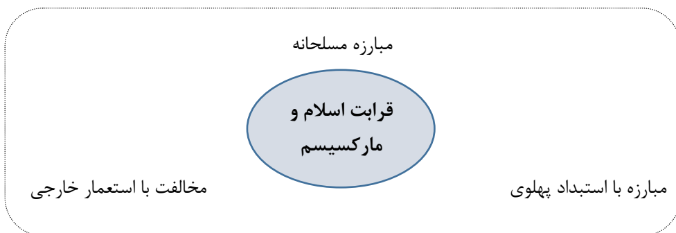
شکل ۵- نمایش دال مرکزی و دال‌های شناور خرده‌گفتمان اسلام‌چپ مسلحانه

مجاهدین خلق، موضعی منفی و مبارزه جویانه ضد نظام سرمایه‌داری و امپریالیسم جهانی داشت. چنانکه در مقاله آموزشی درون سازمانی، نوشته محسن تحت عنوان "استثمار"، به ماهیت استثمارگرانه نظام سرمایه‌داری که منجر به "چپاول و غارت حیات انسانها" می‌شود، اشاره گردیده و نظامات حاکم بر جوامع سرمایه‌داری زیرسوال می‌رود (صابر، ۱۳۸۸: ۹-۳۸۷). مجاهدین، متأثر از آموزه‌های مارکسیسم، با امپریالیسم غیریت ویژه‌ای داشت و مبارزه علیه آن را از مبارزه علیه رژیم‌های دست‌نشانده داخلی متمایز نمی‌پنداشت. در واقع، مبارزه با استبداد پهلوی را همسو با مبارزه با امپریالیسم جهانی قلمداد می‌نمود.