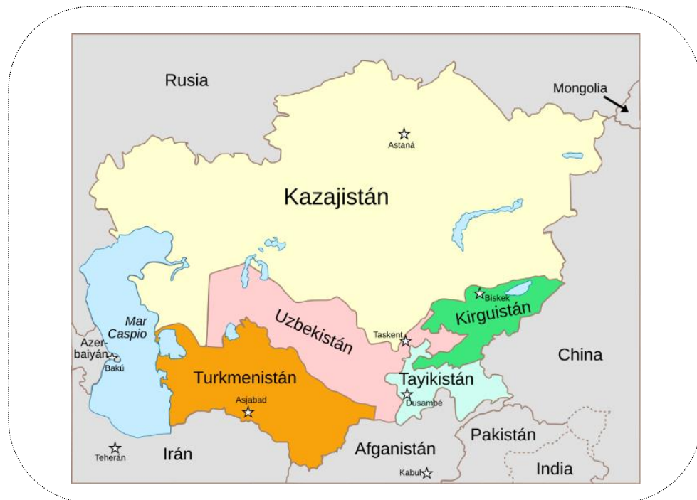
شکل ۱. نقشه سیاسی آسیای مرکزی بعد از تقسیم‌بندی بلشویک‌ها

هارتلند یا همان محور اوراسیا به دلیل ظرفیت‌هایی که دارد سبب تمایل قدرت‌های بزرگ برای رقابت در آن شده است و به همین دلیل از آن به‌عنوان یک حوزه ژئواستراتژیک یاد می‌کنند و منطقه ژئوپلیتیک آسیای مرکزی در دل این حوزه ژئواستراتژیک تعریف می‌شود. در نقشه سیاسی کنونی جهان، منطقه آسیای مرکزی به‌عنوان یک نقطه اتصال دو قاره آسیا و اروپا شناخته‌شده و در معادلات نظام بین‌الملل به‌عنوان یک محور غیرقابل حذف تعریف می‌گردد. آسیای مرکزی که حاشیه جنوبی، اسلامی و آسیایی روسیه محسوب می‌شود، از شمال با روسیه و دریای خزر، از جنوب با ایران و افغانستان و از مشرق به چین مشرف است و با توجه به مجموعه پیوندهای تاریخی، زبانی، دینی با ایران، می‌تواند ظرفیت‌های بالقوه و بالفعلی در سیاست و اقتصاد برای آن همراه داشته باشد که این بهره‌برداری در گرو شناخت صحیح سیاست، فرهنگ سیاسی و به‌عبارتی شناخت ساختار سیاسی حاکم این منطقه است.