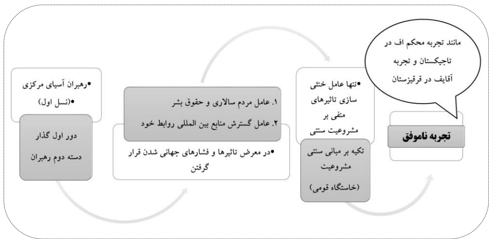
شکل ۲. مقابله با تأثیرهای منفی در ادامه بقا و مشروعیت دسته دوم رهبران در دور اول گذار (نگارنده)

شکل شماره «۲» دو عامل حقوق بشر و مردم‌سالاری و همچنین عامل گسترش منابع روابط خارجی اثر منفی بر ماهیت مشروعیت سنتی رهبران آن‌ها گذاشتند. به دلیل عدم توانایی آن‌ها در گشایش اقتصادی به واسطه ضعف جدی مبنای اقتصادی و همچنین گشایش سیاسی به دلیل ترس از وقوع انقلاب رنگی، تنها عامل خنثی‌سازی یا تخفیف آثار منفی عوامل یادشده، تکیه کردن بر روی مبانی سنتی مشروعیت بود و چون این مبانی، ارزش‌های کافی برای خنثی‌سازی تأثیرهای منفی مبانی مدرنیته مشروعیت را نداشتند سبب بروز بی‌ثباتی شدند. البته قرقیزستان با رویکرد رفتن به سمت مردم‌سالاری به دنبال پر کردن خلأ بود ولی چون منابع اقتصادی بسیار ضعیفی داشت، تجربه موفق‌تری کسب نکرد و کشور به سمت انقلاب رنگی هدایت شد و آقای سقوت کرد، تاجیکستان هم به همان دلیل با یک بی‌ثباتی مخاطره‌انگیز روبرو شد و به خاطر عدم توانایی در مدیریت آن، مناقشات داخلی بروز کرد و بر اثر آن امام‌علی رحمان بر سر قدرت آمد.