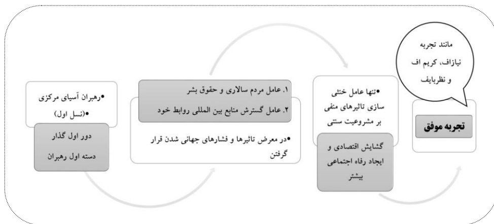
شکل ۱. مقابله با تأثیرهای منفی ادامه بقا و مشروعیت دسته اول رهبران در دوره اول گذار (نگارنده)

می تواند عامل کنار زدن سهل گروه های تهدیدزا یا بحران زا، تقویت قوه قهریه حکومت و اقداماتی از این قبیل گردد و در زمان صلح و ثبات کشور نیز، اقتدارگرایی سخت گیرانه تری را نسبت به کشورهای فاقد این توانایی ترتیب دهد. به صورت کلی این دسته از رژیم های آسیای مرکزی با تکیه بر دو عامل امنیت و اقتصاد و با به تصویر کشیدن رژیم هایی که در تأمین امنیت دغدغه ای ندارند، بدان معنا که توانایی مدیریت کردن هر رخدادی را قبل از بحرانی شدن داشته و رشد اقتصادی بهتری نسبت به سال گذشته دارند، می توانند از آن ها به عنوان دو عامل مؤثر جهت مشروعیت حکومت خود استفاده کنند (Matveeva, 2009: 1098).